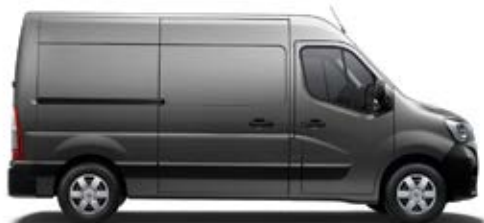
Фургон со погон на предни тркала

Многу разновидни потреби на корисниците можат да бидат задоволени со богатата понуда на внатрешна опрема како и комбинации на должина и висина на новиот Renault MASTER со зафатнина на товарниот простор од 8 до 22 m 3 .