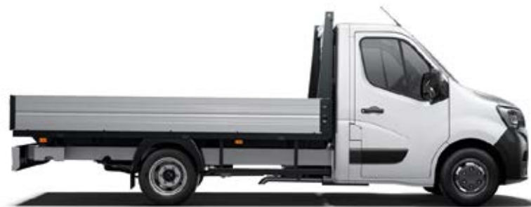
Сандак со спуштена страница