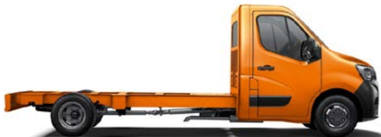
Шасија со кабина