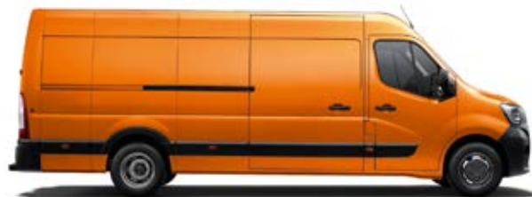
Фургон со погон на задни тркала