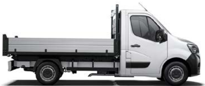
Кипер со тристрано или задно кипање

Новиот Renault MASTER е достапен во многу верзии помеѓу кои е и кипер со тристрано или задно кипање. Везијата на шасии со кабина се идеални за секаква намена.