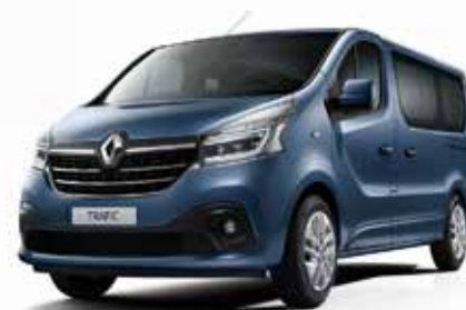
Сина Panorama (J43)**