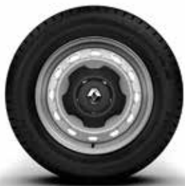
41 cm (16") фелна Mini