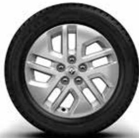
43 cm (17") алуминиумски фелни Cyclade