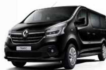
Црна Midnight (D68)**