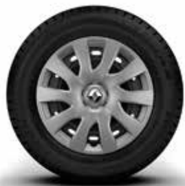
41 cm (16") фелна Maxi