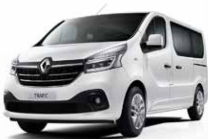
Ледено бела (369)*