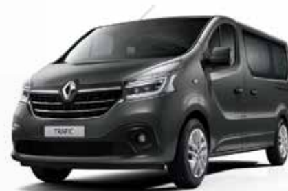
Сива Urban (KPW)*