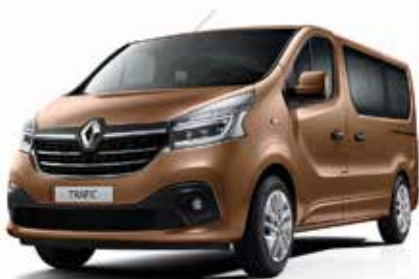
Бакарно кафена (CNH)**