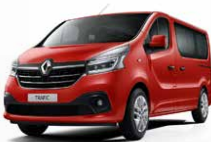
Црвена Магма (NNS)*