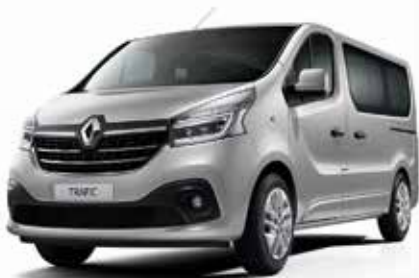
Сива Platina (D69)**