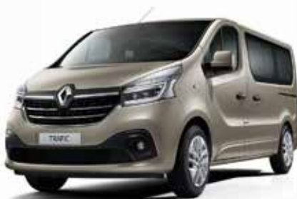
Пепел беж (HNK)**